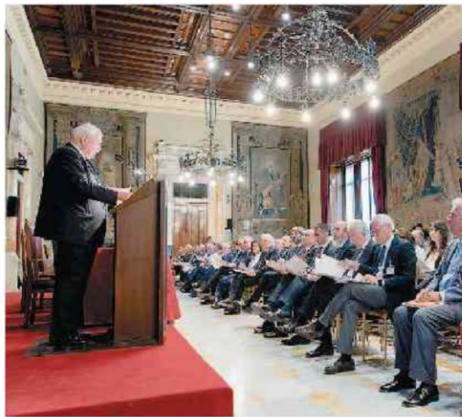
Un momento della relazione annuale di Agcom ieri a Roma