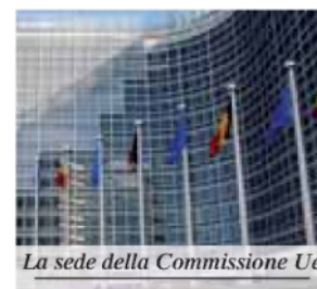
La sede della Commissione Ue