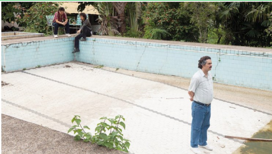
Tv liquida. Il serial Narcos (nella foto il protagonista Pablo Escobar) è stato uno dei più seguiti su Netflix