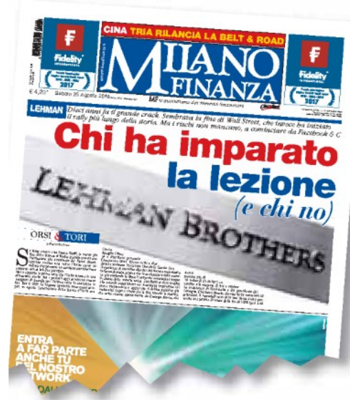
La copertina di Milano Finanza del 25 agosto