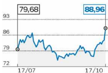
Andamento del titolo