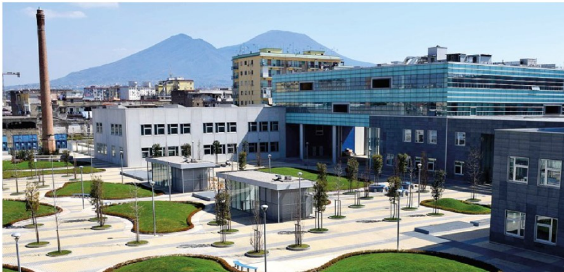
Innovazione. Il polo universitario della Federico II a San Giovanni a Teduccio