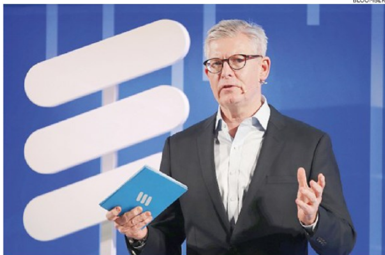
Ericsson. Il ceo Börje Ekholm