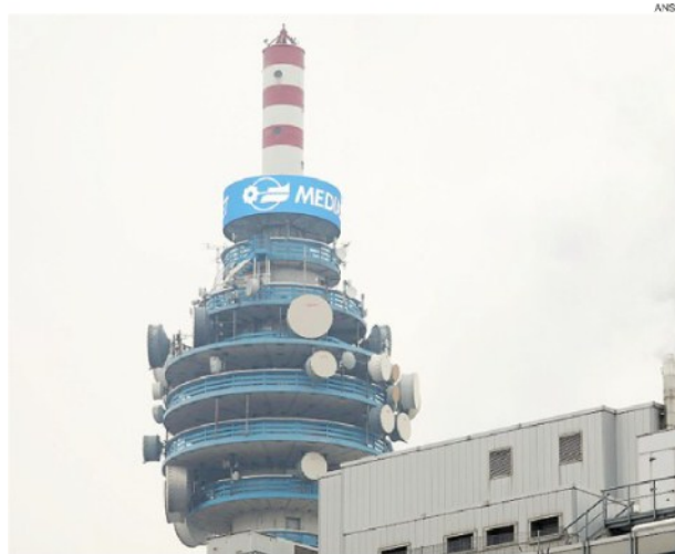
Il riassetto del gruppo. La sede di Mediaset