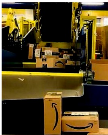
Il centro di smistamento pacchi di Roserio

■ In un anno, il commercio on line è cresciuto del sedici per cento in Lombardia e del tredici in Italia. In cinque anni, la crescita registrata è addirittura del sessanta per cento nel territorio regionale, del 68 a livello nazionale. Secondo un'elaborazione della Camera di commercio di Milano Monza Brianza e Lodi sui dati del registro delle imprese, nella regione sono 3.658 le imprese attive e 19.710 nel Paese. Il settore, inoltre, impiega oltresettemila addetti, su 29mila a livello nazionale, ovvero un quarto del totale.