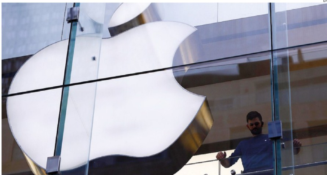
La partita sui contenuti. Apple alza a 6 miliardi di dollari gli investimenti per le produzioni originali destinate allo streaming