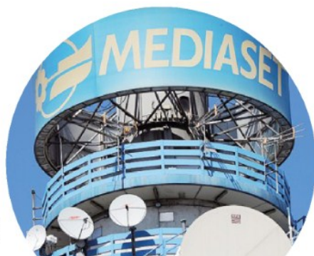
Il 4 settembre l'assemblea Mediaset. Al vaglio dei soci il progetto di fusione con la Spagna e la creazione di Mfe

Il proxy advisor Iss suggerisce invece di votare contro l'approvazione della fusione alle prossime assemblee del 4 settembre. Per quanto Iss riconosca le ragioni strategiche dell'operazione, vede «notevoli preoccupazioni in termini di governance» e «una riduzione dei diritti degli azionisti di minoranza» in seguito al sistema di voto maggiorato.