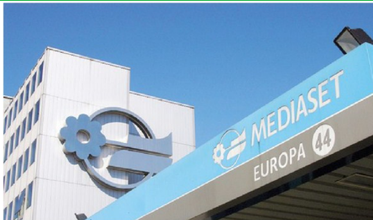
La contesa. Nuova tappa del confronto-scontro tra Fininvest e Vivendi