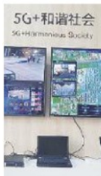
Il tour Dimostrazioni e sede di Zte a Shanghai