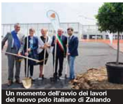
Un momento dell'avvio dei lavori del nuovo polo italiano di Zalando

VeronaModa evidenzia elementi di debolezza che devono essere oggetto di riflessione con la regione nell'ambito delle competenze e con finanziamenti stabiliti dalla legge regionale 8/2003 e successive modificazioni. Per questo, auspico un tavolo tra tutti i soggetti interessati, istituzioni e imprese, per creare quell'attività di lobby che abbia come obiettivi principali l'accrescimento della concorrenzialità delle nostre aziende e la rappresentanza di interessi presso l'operatore e-commerce per favorire rapporti commerciali stabili e duraturi». (riproduzione riservata)