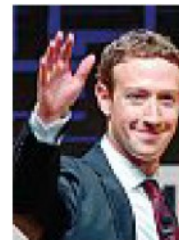
Fondatore Mark Zuckerberg (34 anni)